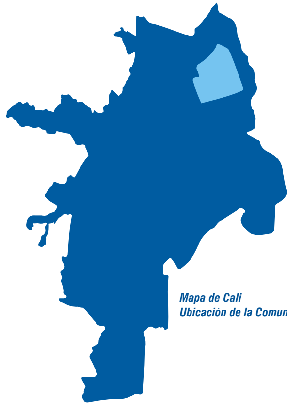
Mapa de Cali Ubicación de la Comuna 5

El Centro de Atención Local Integrada - Cali 5 que atiende los habitantes de dichos barrios está ubicado en la Calle 67 con Carrera 1D Barrio Guayacanes, descentralizados los servicios que presta la Administración Municipal con el fin de ofrecer una mejor atención a los habitantes, Entre los servicios que presta se encuentra Tesorería, Hacienda (predial) y Emcali (Teléfonos).